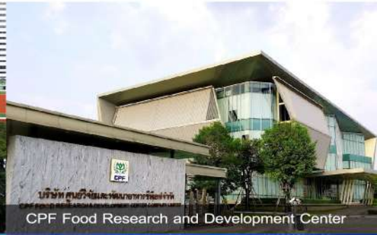
CPF Food Research and Development Center