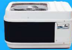
Fiber Glass Casing Condensing Unit 10,000-60,000 BTU/H