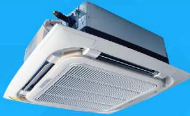
Cassette Type (Dx & CW) 18,000-50,000 BTU/H : Mark 5