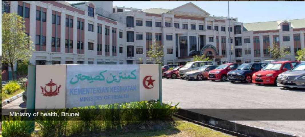
Ministry of health, Brunei