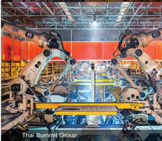
Thai Summit Group