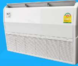
Universal Type (DX) 13,000-60,000 BTU/H : Mark 5