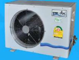
Fiber Glass Casing Condensing Unit 13,000-60,000 BTU/H : Mark 5