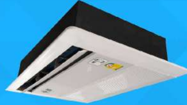
One Way Cassette Type (Dx & CW) 14,000-60,000 BTU/H : Mark 5