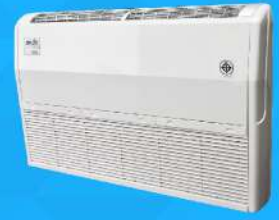
Universal Type (DX & CW) 12,000-60,000 BTU/H