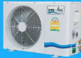
Metal Sheet Casing Condensing Unit 13,000-60,000 BTU/H : Mark 5