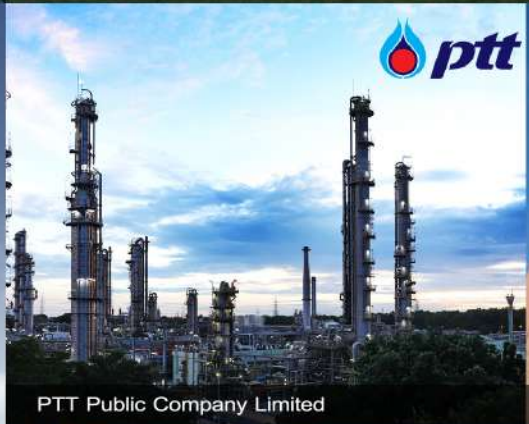
PTT Public Company Limited