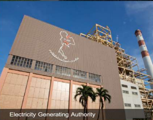
Electricity Generating Authority