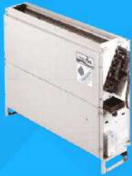
Furniture Built-in FCU (Dx & CW) 10,000-60,000 BTU/H