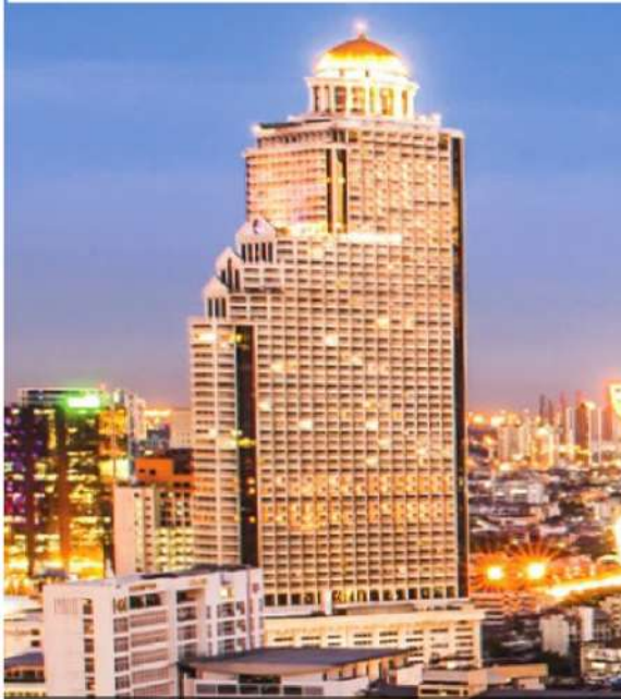
Nusa State Tower Bangkok