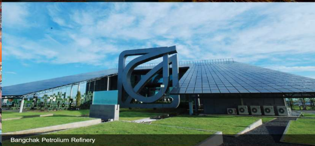
Bangchak Petroleum Refinery