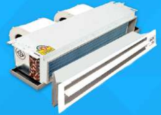
Ceiling conceal Type (Dx & CW) 13,000-60,000 BTU/H : Mark 5