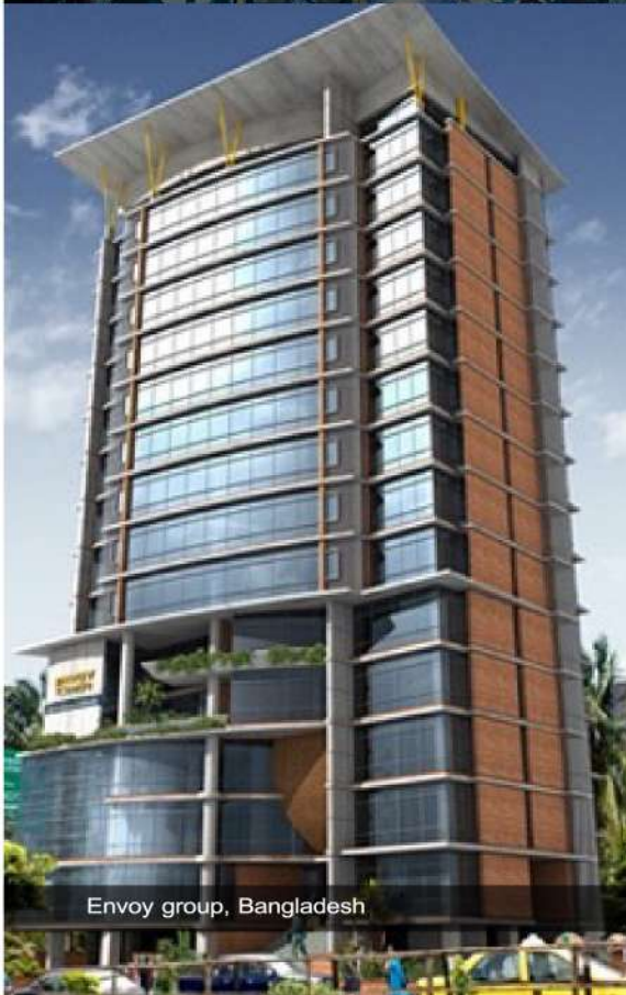
Envoy group, Bangladesh