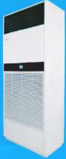
Floor Standing Type (Dx & CW) 40,000-250,000 BTU/H