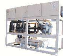
Packaged (sea) Water-Cooled Chiller