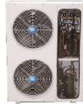
Multi - Compressor Condensing Unit