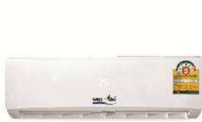
Wall mount FCU

Residential : เครื่องปรับอากาศสำหรับที่พักอาศัย