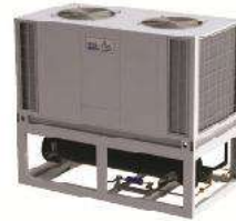
Packaged Air-Cooled Chiller