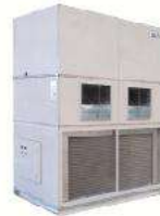
Packaged (sea) Water-Cooled AHU