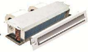
Ceiling Conceal FCU