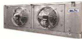
Food grade, easy to clean FCU