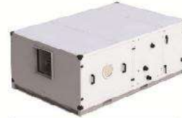
Double Skin AHU