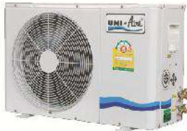
Metal Sheet Casing Condensing Unit