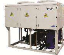
Packaged Air-Cooled Chiller