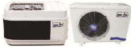
Fiber Glass Condensing Unit Anti corrosion purpose for seaside area