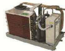
Packaged (Sea) Water-Cooled unit