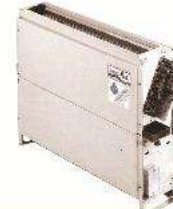
Furniture Built-in FCU