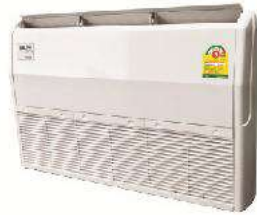
Floor mount & Ceiling mount FCU