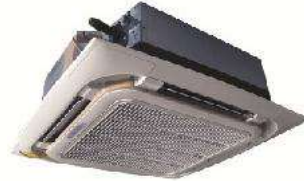
Ceiling mount Cassette FCU