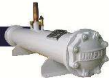
Shell & Tube (sea) Water Cooled Condenser