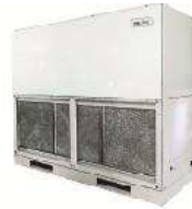
Single Skin AHU