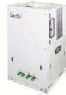
Plug&Play Mini Air-Cooled Chiller Equipped with water tank and water pump