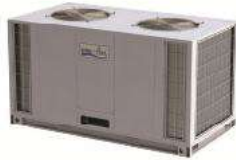
Air-Cooled Condensing Unit