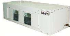
High Static Ducted FCU