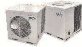
Air-Cooled Condensing Unit