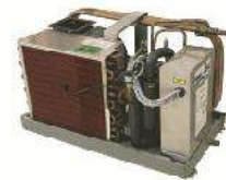
Packaged (Sea) Water-Cooled unit