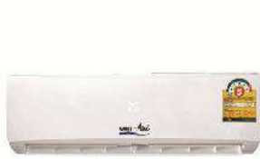
Wall mount FCU

Residential : เครื่องปรับอากาศสำหรับที่พักอาศัย