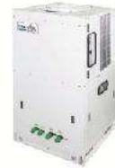
Plug&Play Mini Air-Cooled Chiller Equipped with water tank and water pump