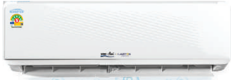
แผ่นคอยล์ยูนิต รุ่น : WXI-F2