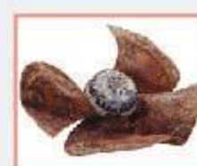
ใบพัดเป็นสนิม