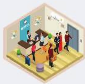
โรงพยาบาล