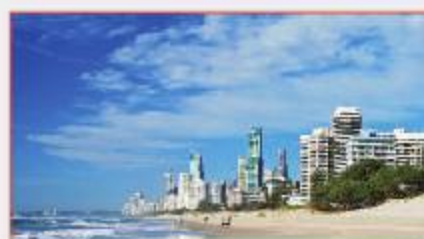
พื้นที่ใกล้ทะเล