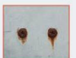
นอตเป็นสนิม