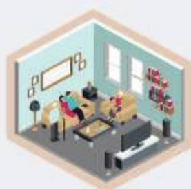
บ้านพักอาศัย