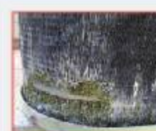
พินถูกกัดกร่อน