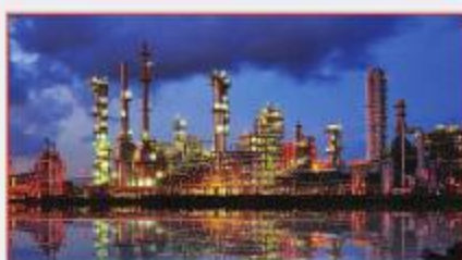
โรงงานอุตสาหกรรม