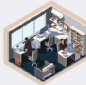
สำนักงาน