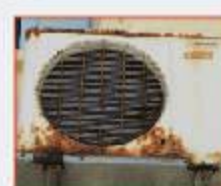
ตัวถังพู่เป็นสนิม